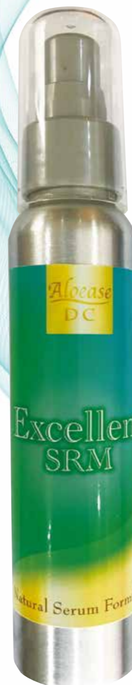
エクセレントセラム 内容量：80g 標準価格：5,800 円 (税抜)