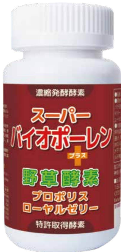
標準小売価格：5,000 円 (税抜)

スーパーバイオポーレンは1粒中に花粉エキス成分を 150mg も含有しています。さらに 60 種類の野草、野菜、果物と 52 種類の有用微生物菌で1年半以上熟成発酵した野草酵素にプロポリス、ローヤルゼリーを豊富に配合しています。特許取得の熟成発酵技術により、花粉の殻の細胞膜を破砕することに成功し栄養成分の体内吸収を抜群に高めています。