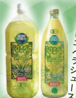
ナチュラルピュア