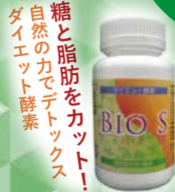
ダイエット酵素 バイオS