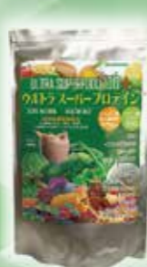
ウルトラスーパー プロテイン