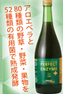
パーフェクトエンザイム