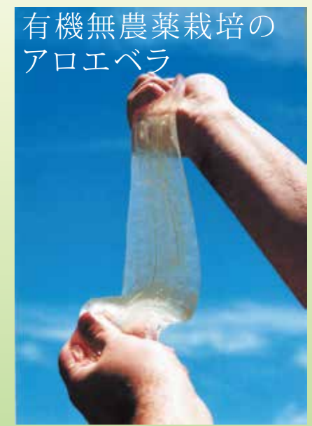
表皮を剥ぎ取ったばかりの最も新鮮なアロエベラ葉肉