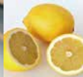
レモン果実エキス