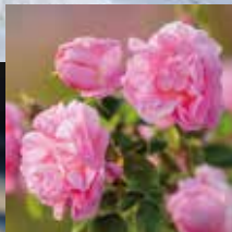
ダマスクバラ花エキス