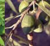
オリーブ葉エキス